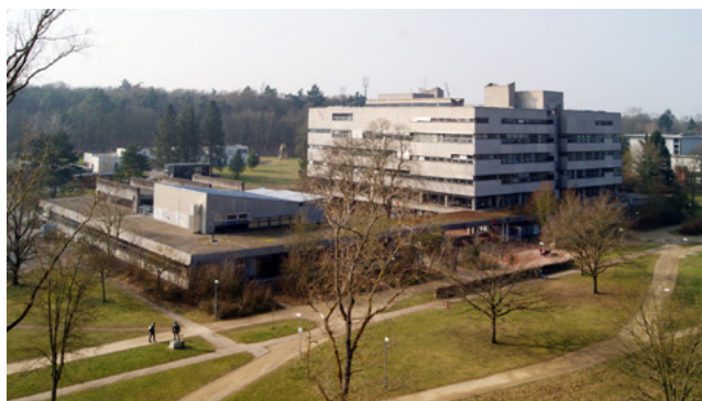
Gebäude des Fachbereichs Architektur L3|01

Ihr Studium beginnt mit der sogenannten Orientierungswoche (O-Woche) am Montag, 08. Oktober 2018, 13.00 Uhr im Hörsaal L3/01 93 (Max-Guther-Hörsaal) des Architekturgebäudes auf dem Campus Lichtwiese (am südlichen Stadtrand von Darmstadt), El-Lissitzky-Str. 1. (Siehe Lageplan unten).