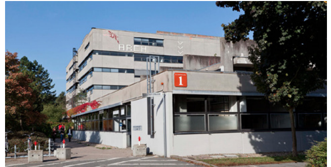
Aussenansicht Gebäude des Fachbereichs Architektur L3|01

Lageplan Campus Lichtwiese, TU Darmstadt | Fachbereich Architektur siehe Gebäude L3|01 (Pfeil).